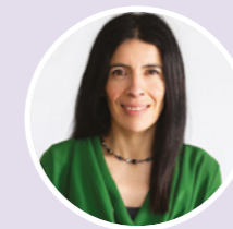
Rocio Cifuentes MBE Comisiynydd Plant Cymru